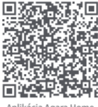
Aplikácia Aqara Home

Aplikácie Store alebo naskenujte QR kód nižšie.